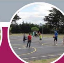
terrains de basket et de foot