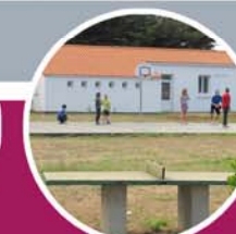
tables de ping-pong