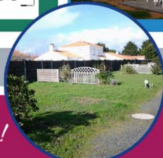
emplacements natures, vastes et agréables