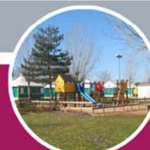
aires de jeux